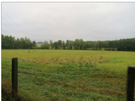
Foto č. 14: Pohled od vodního zdroje Krchlovka do nivy Martinického potoka