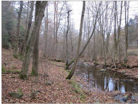
Foto č. 6: Krounka v profilu hráze, pohled proti proudu, listopad 2016