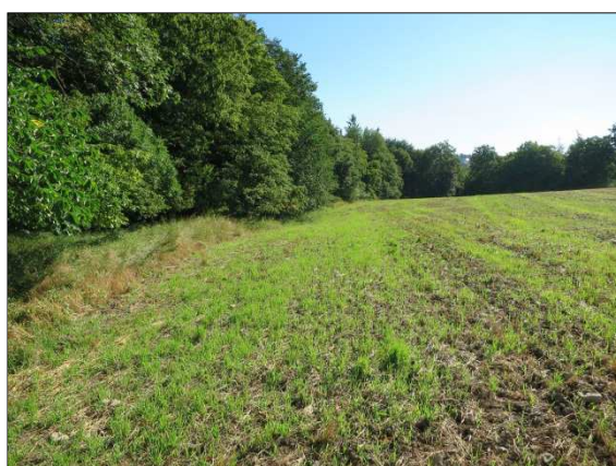
Foto č. 18: Prostor zařízení staveniště nad pravostranným závazáním hráze