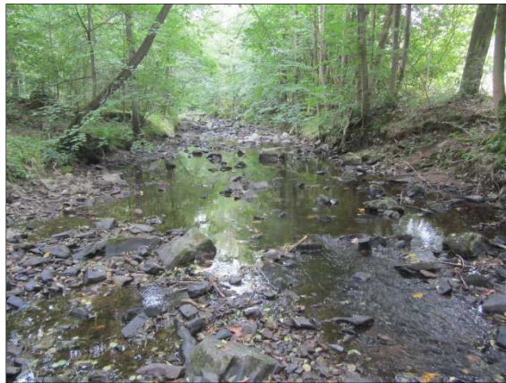
Foto č. 5: Krounka v profilu hráze, pohled proti proudu, srpen 2016