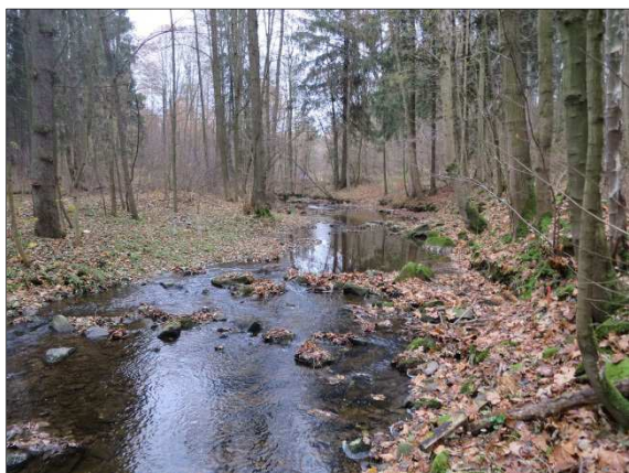
Foto č. 3: Krounka v profilu hráze, pohled po proudu, listopad 2016