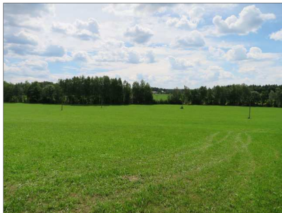
Foto č. 17: Pohled do nivy Martinického potoka, prostor budoucího zemníku