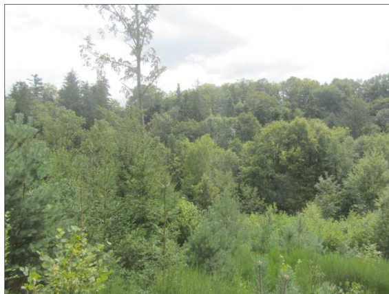
Foto č. 4: Pohled v ose hráze z bezpečnostního přelivu nad korunou hráze